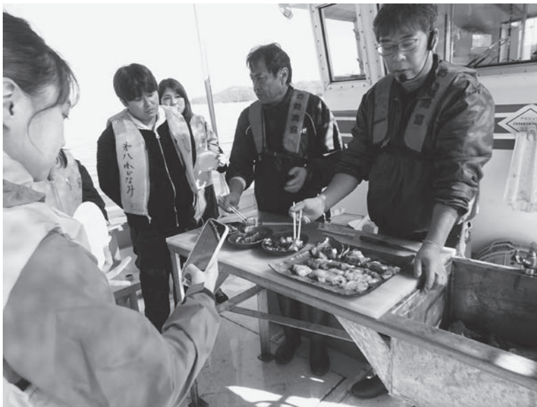
「まるごと協同ツアー」 水揚げされたばかりの鯛などのお刺身を船上でいただく