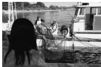
漁業観光船に乗り、至近距離で定置網漁の見学