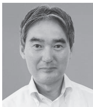
ひょうご消費者ネット 理事長