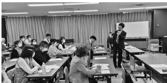
座長である姫路医療生協 黒岩専務が進行