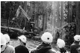
森林整備現場見学 宍粟市波賀町 しろう森林組合【川上】

参加者は「普段自分たちでは行けない場所（木の伐採やセリの現場）を見る機会をいただき、ありがたかった」「実際の伐採を見ると迫力がありました」「兵庫県の木を使うようにしたい」と感想を述べていました。