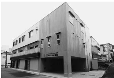
2024年11月にオープンした「ケアベース水道筋」