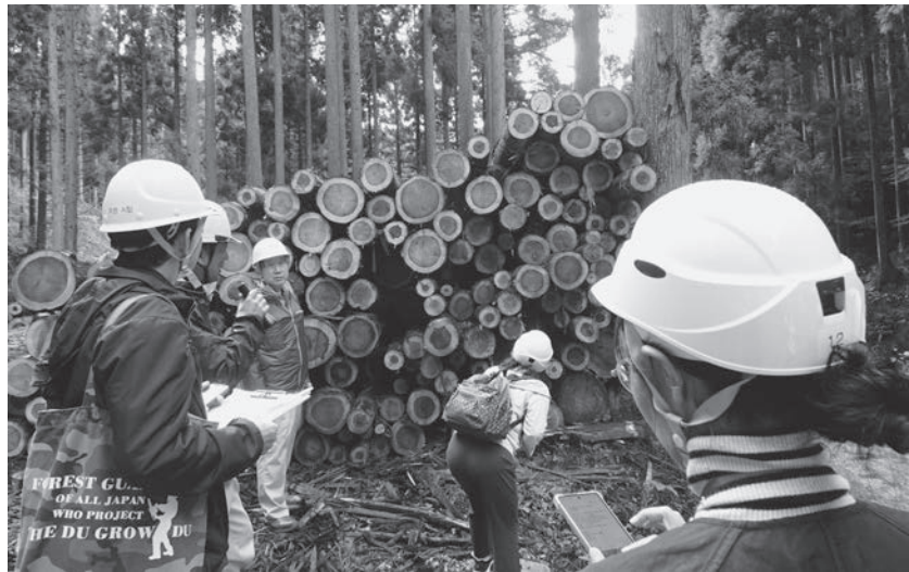
「協同組合研究・交流会 ～林業の役割を学んでみませんか～川上から川下へ」 杉の伐倒から丸太にされるまでを見学