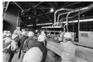
株宮下木材 加東市【川下】