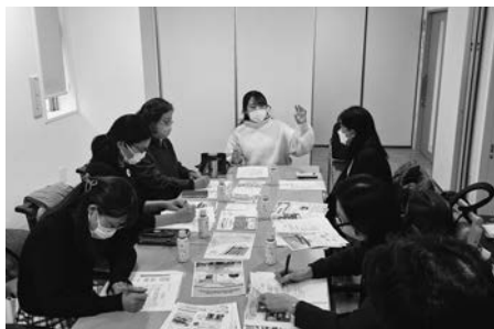
チラシや機関紙、プレゼント品などを見せてもらいながら、増資について話を聞きました