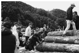
株山崎木材市場 宍粟市山崎町【川中】