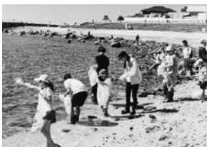
アサリ稚貝の放流の様子