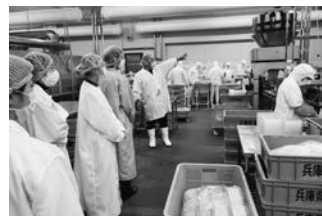
水産加工センターの見学