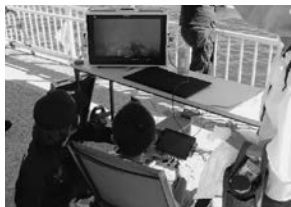
水中ドローンを操縦する様子