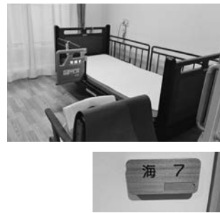
3階の居室には神戸らしく「山」「海」の部屋番号がついています