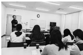
各組織の紹介をして、協同組合の魅力をPR