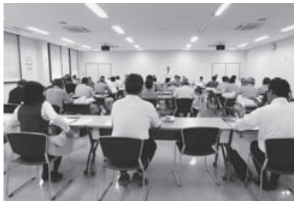
担い手農家懇談会の様子

今後も農家の所得向上に向けて、地域の農家に寄り添って、担い手の声を大事にした支援を行っていきます。