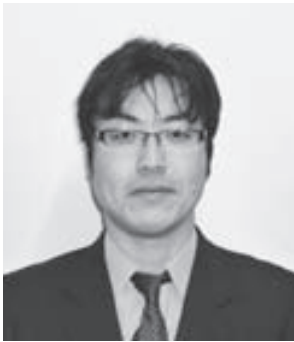
西宮市職員生活協同組合 事務局長