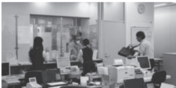
強盗に包丁を突きつけられる窓口職員

また、「過去5年間で、県下で発生した金融機関を狙った強盗事件は4件で、いずれも検挙に至っている。金融機関の防犯意識の高まりによって、発生件数は少なくなっているが、近年は不特定多数の人から現金を騙し取る特殊詐欺被害が急増している。金融機関の方には、高齢の顧客の不審な振り込みや高額現金の引き出しには、窓口での積極的な声掛け等の水際阻止に努めて頂きたい」との被害未然防止の協力要請があり、各職員が日頃から防犯対策に心掛けることを再確認しました。