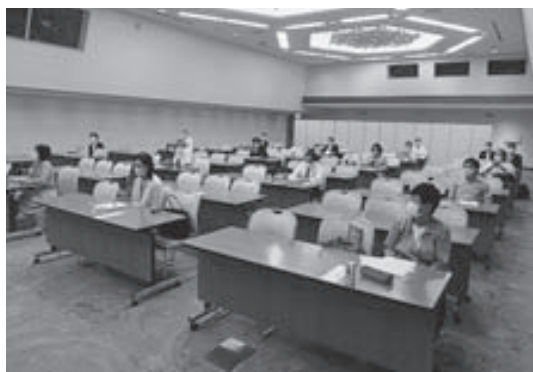
第70回通常総会は規模を縮小して開催されました